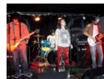
VUCAQUE VIERNES 9. 21:00 H.