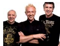
LA UNIÓN JUEVES 8. 21:45 H.