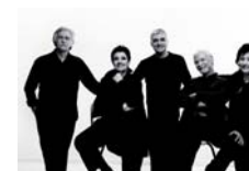
EL CONSORCIO SÁBADO 10. 22:00 H.