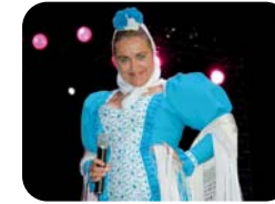
EVA Y SU MADRID