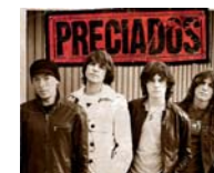
PRECIADOS VIERNES 9. 22:30 H.